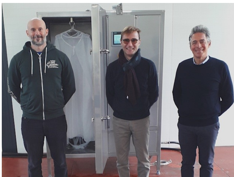
Fig. 1: DPI lavabili con tecnologia implementata