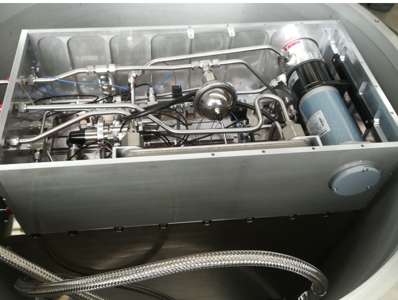
Fig. 2: 3DP durante test di tenuta in camera da vuoto