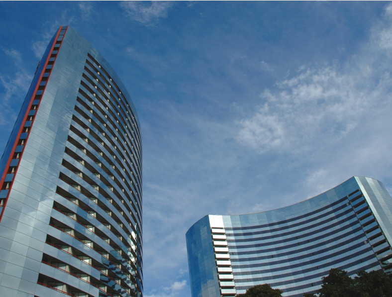
Fig. 2: Esempio di edificio a condominio nel quale è possibile applicare una riqualificazione urbana