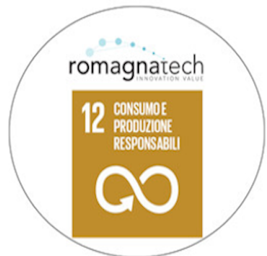
Fig. 1: Servizio a supporto della Sostenibilità Produttiva – 12° Obiettivo dell' Agenda 2030 per lo Sviluppo Sostenibile